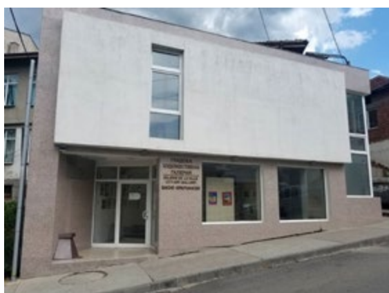
Градска уметничка галерија "Васил Крпчански"

Од интереса за туристе из земље су и сеоски празници, маскарадни празник „Кукери“ и неки мање типични за друга места празници и догађаји. Али, за стране туристе сви празници, прославе, догађаји везани за бугарске традиције и културу који преносе бугарске обичаје и традиције, представљају велики интерес.