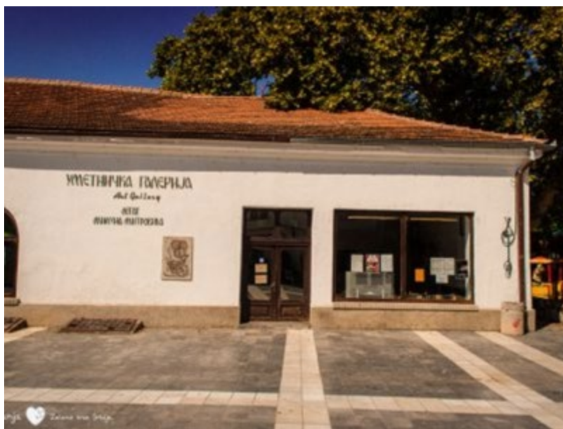
Уметничка галерија у Сокобањи