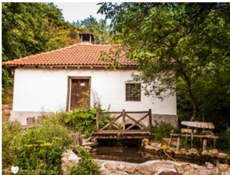
Етно музеј у Врмци

Етно музеј у Врмци је отворен 2010 године и налази се у згради еноријашког дома. Има сталну поставку народних ношњи, керамике, текстила и алата. Посетиоци могу да прате цео процес израде народних ношњи на традиционалан начин.