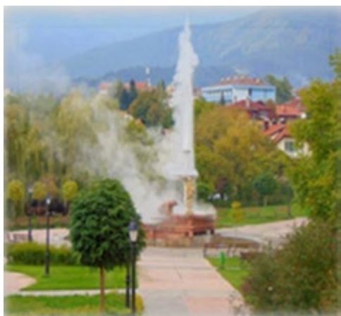
Гејзир-фонтана 103° у Сапаревој Бањи

Са стратешког гледишта здравствени туризам /који обједињује услуге/ има озбиљан потенцијал за развој у комбинацији са скоро свим осталим врстама туризма - планински туризам, културни туризам, летњи туризам, спортски туризам, пословни туризам, гурмански туризам, фестивалски туризам, еко-туризам, сеоски туризам, верски туризам и сл.