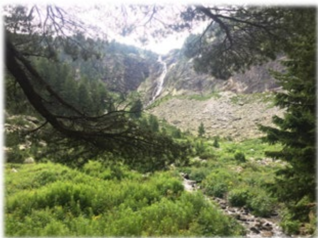
Водопад Скакавица, Сапарева Бања, Бугарска

планинско пењање са планински водичем, планинске туре различите тешкоће, укључујући туре са скијама са шаркама, скијама за трчање, са крпљама за снег, екстремним скијама, експедицијски /високопланински туризам према планинским врховима, сноуборд и друго. Према подацима Adventure Tourism Development Index-а, Бугарска је међу првих 10 земаља са најбржим и највећим потенцијалом за развој авантуристичког туризма. Партнерство са Србијом би само могло повећати тај потенцијал.