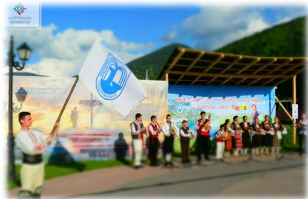
Сапарева Бања – душа Бугарске