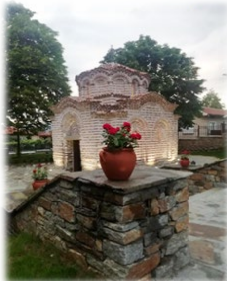
Средњовековни храм Св. Николе