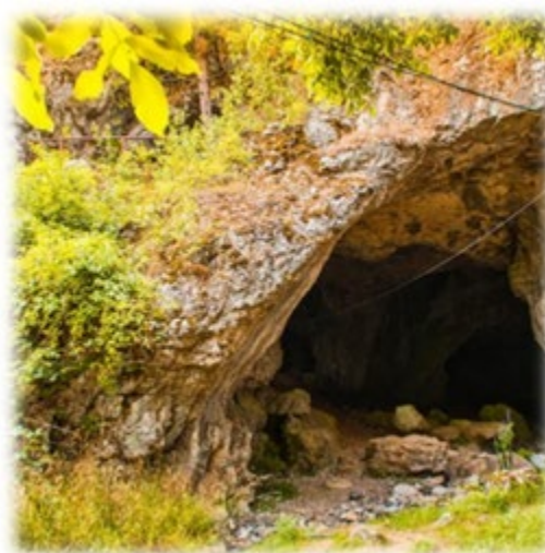
Пећина Сесалац, Сокобања, Србија

Културни туризам такође заузима велико место међу разлога за избор места за одмор.