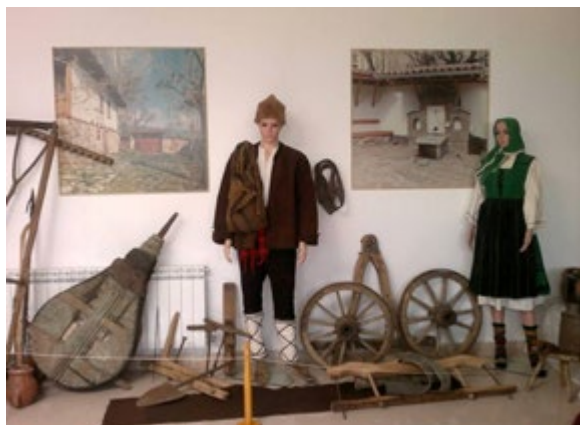
Етнографска поставка у згради за излагање етнографског наслеђа

Лазаровање, Коледари, литерарна читања итд. НЧ "От извора-2013", град Сапарева Бања, у партнерству са општином Сапарева Бања и ТВ Родина сваке године одржава међународни фолклорни фестивал МФФ "Сапарева Бања", под насловом „Гора пева, девојка се љуља“, који изазива велики интерес учесника и гостију града.