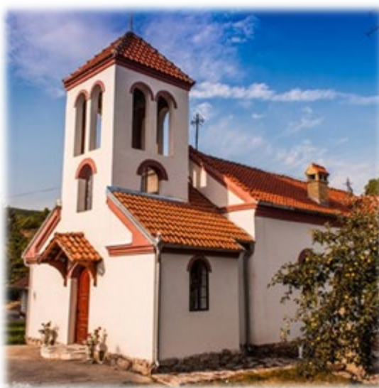
Црква Св. Димитрија