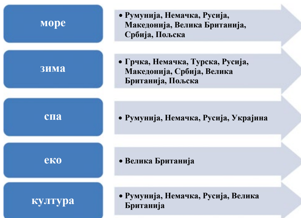
Фиг. 2. Мотивација на емитивним тржиштима за посету Бугарске као туристичке дестинације