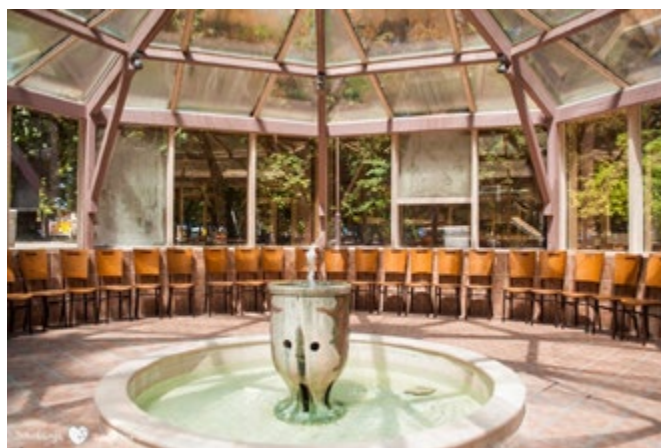
Просторија за инхалације - део Турског купатила у центру Сокобање

Све је то, међутим, у директној вези са неопходношћу да општинске управе Сапареве Бање, Бугарска, и Сокобање, Србија, развијају и примењују доследну и циљану политику усмерену на афирмисање туристичког потенцијала стварањем повољног законског, економског, социјалног, културно-историјског, еколошког и активно цивилног окружења за одрживи развоја.