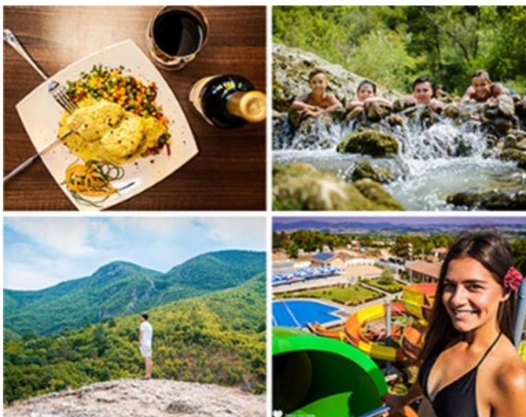
Сокобања - зелено срце Србије

„Овај стратешки документ је резултат испуњења активности бр. 4 у склопу пројекта: СВ007.1.11.075 „Балнеолошки туризам - будућност здравства“, који се реализује у склопу програма Интеррег-ИПП за прекограничну сарадњу Бугарске и Србије 2014 - 2020, са референтним бројем No. 2014ТС1615СВ007 - 2015 - 1. Општина Сапарева Бања је у својству корисника по уговору №РД-02-29 - 362/ 14.12.2017, који је закључен са Министарством за регионални развој и урбанизам. Партнер по пројекту је српска општина Сокобања.“